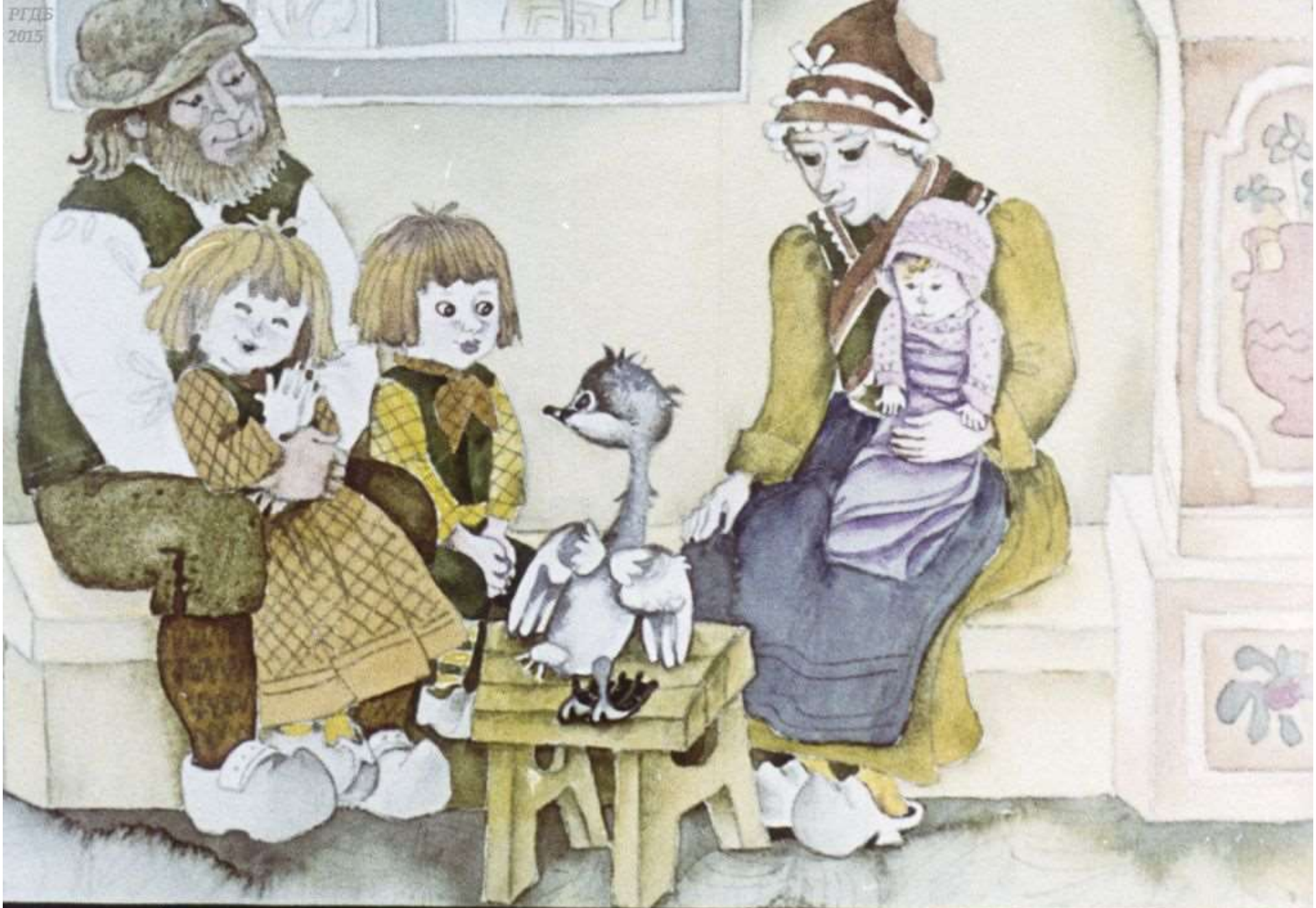
В доме крестьянина беднягу отогрели.